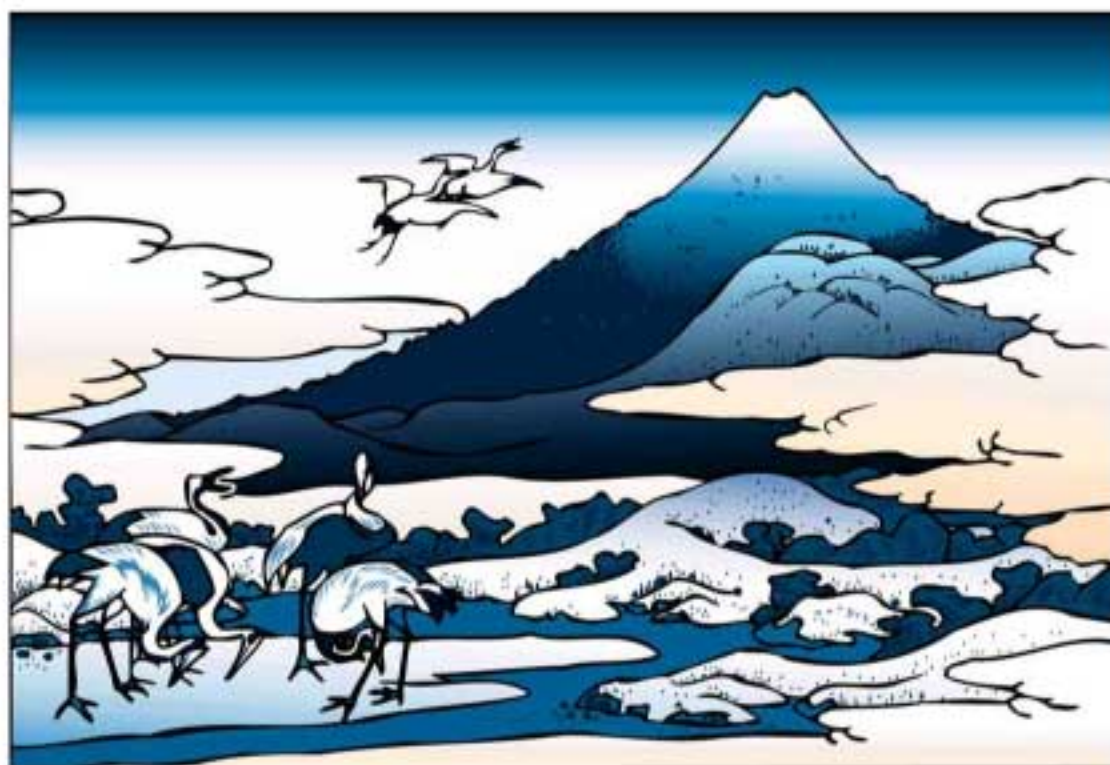
富士山の写真が撮れなかったのでイラストで失礼致します